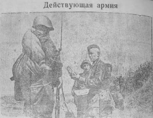
Раздача подарков от трудящихся бойцам на передовых позициях (Западное направление).